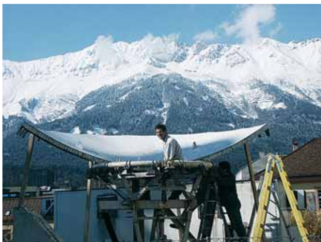
Горнолыжная Австрия: чем заманить клиента