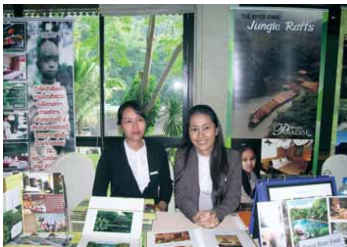
Воркшоп в Канчанабури

Но провинция Канчанабури интересна не только своей историей. Главной ее достопримечательностью можно назвать изумительно красивую природу. Потрясающие водопады, изумрудно-зеленые парки, фруктовые плантации, живописные равнины, горы, покрытые пышной тропической растительностью, – это