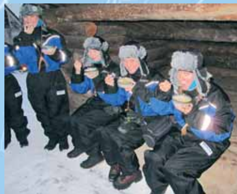
Знатный был супчик!

К удивлению многих, я до сих пор не научилась водить машину. В этом, откровенно говоря, не чувствую никакой необходимости, а тем более – угрозы со стороны. В Доминикане год назад мне с первого раза поддались автокар и сивгей, а в Лапландии я дважды ставила свои рекорды скорости на снегоходе. В стране снежных лесов и ледяных озер этот вид транспорта достойно заменяет автомобили. И если гово-