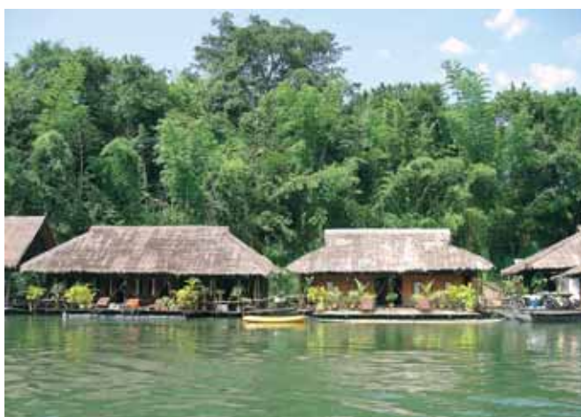
Таиланд: как сохранить российский турпоток