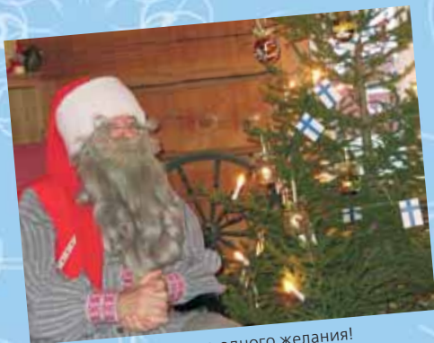
Достаточно одного желания!

Куда можно лететь с ветерком на снегоходах? Конечно же, на рыбалку! И если костюм с карманами на тебе и червяки готовы стать добычей голодных рыб, можно смело садиться с миннудочкой к собственноручно прорубленной лунке. В таком деле главное – запастись терпением, и тогда успех превзойдет все ожидания. Но, даже если не удалось перехитрить ни одного затихарившегося налима или окуня, печалиться не стоит – как известно, настоящий рыбак получает удовольствие от самого процесса, а потому отрицательный результат – тоже результат! Зачерните чистой водой озерную водичку и попробуйте ее на вкус. Обернитесь вокруг, вдохните полной грудью и закройте на мгновение глаза... Время, отведенное на подводный лов, заканчивается быстро. Пора вновь садиться на «коня»