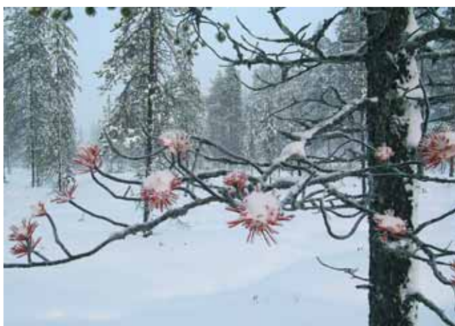
Коттеджный туризм: 2-1 в пользу финнов...