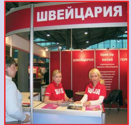
Туроператор OPEN UP – Ваш надежный партнер по Швейцарии