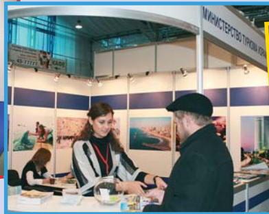
В этом году ценовые предложения в Израиль доступны как никогда