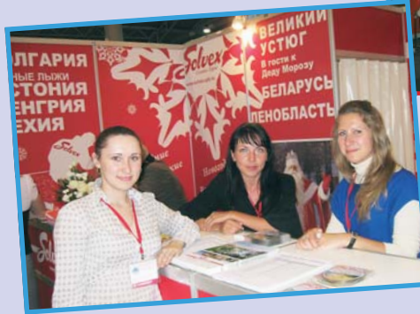
«Солвек» готов к началу зимнего сезона!