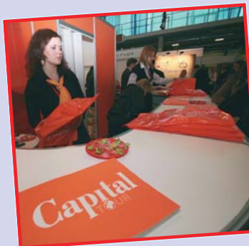
«Капиталистические» каталоги всегда на виду у турагентств