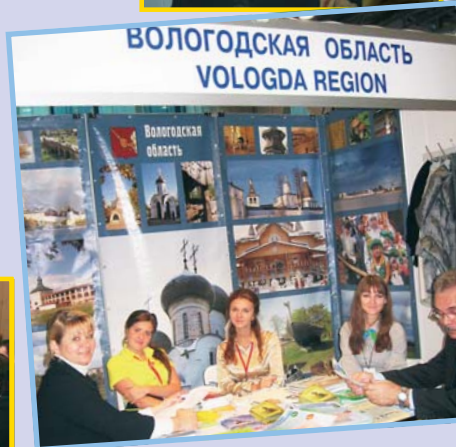
В Вологодской области к зиме готовятся особенно тщательно. Дед Мороз из Великого Устюга уже готовит подарки для своих гостей...