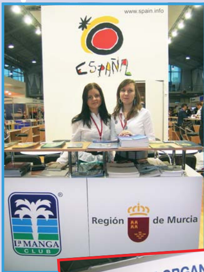
Провинция Мурсия – новая страница испанского туризма, где расположены лучшие спортивные центры и клубы