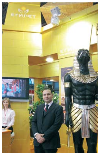
На фото: Исмаил А. Хамид Амир, туристический атташе Египта в России