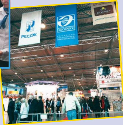
Залог успеха любого мероприятия – в желании работать!