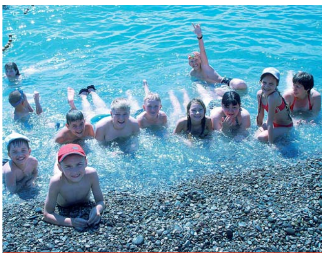
Итоги лета с поправкой на сегодняшний день