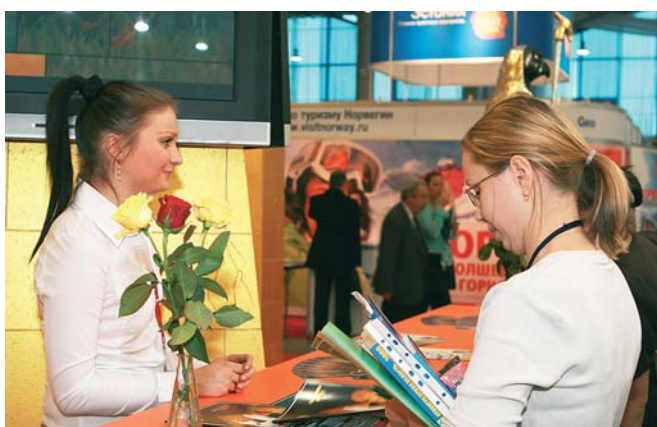
Выставки Петербурга: работаем с удовольствием