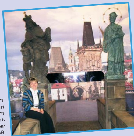
Карлов мост даже вдали от родины дает возможность насладиться своей красотой!