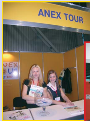
Известные компании Anex tour и BSI group – новички питерского рынка и выставки INWETEX