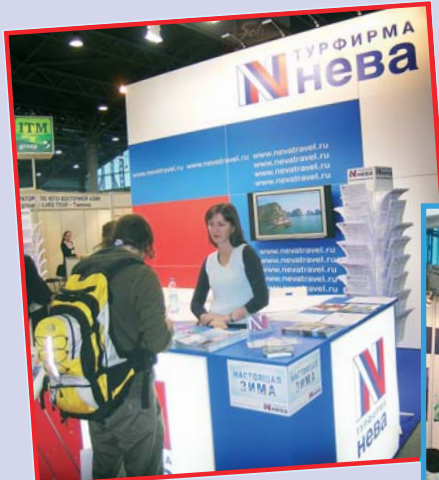
С невских берегов к Золотым воротам Лапландии и экзотической Табе