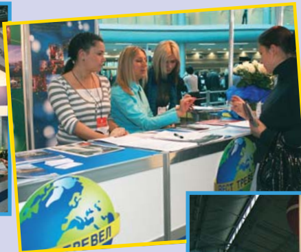
«Вест-трелл» и «Аэротрэвел клуб» – проверенные временем питерские туроператоры