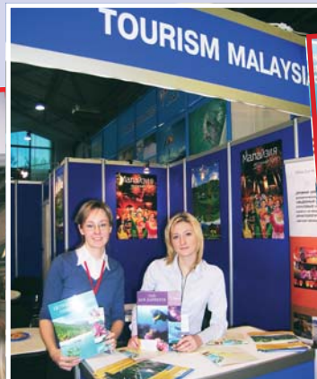
Помимо отдыха Малайзия намерена активно развивать шоп-туризм...