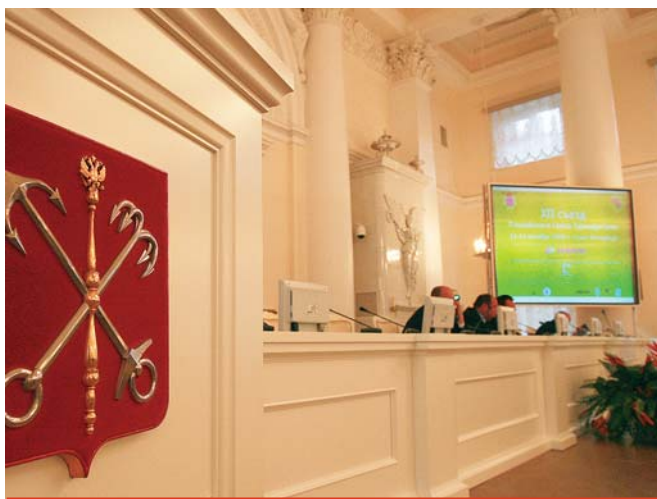
Съезд РСТ - как сделать российский туризм высокодоходной отраслью экономики?