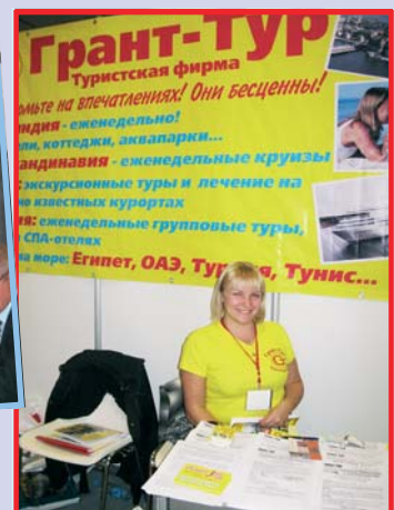
Продавец бесценных впечатлений – компания «Грант-Тур»