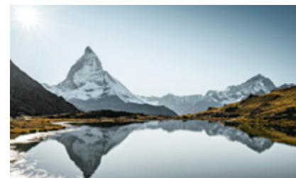
Отдых на озерах