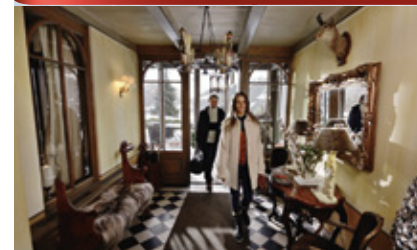
Аренда вилл и шале