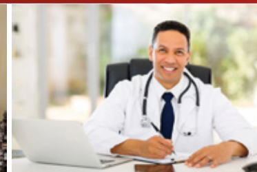
Лечение за рубежом