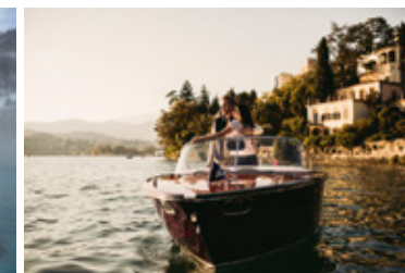
Аренда катеров и яхт