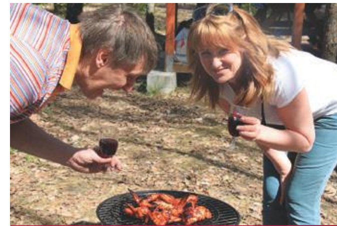
Гастрономический туризм – удел гурманов 8–10