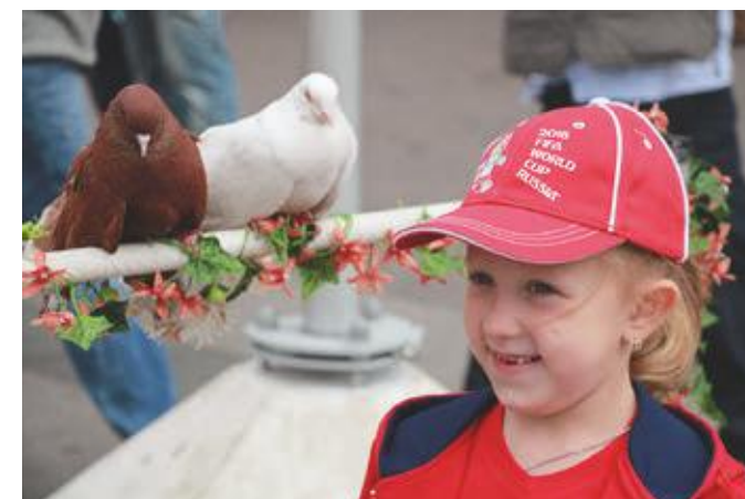
Туризм в России: все дело в шляпе... 14–16