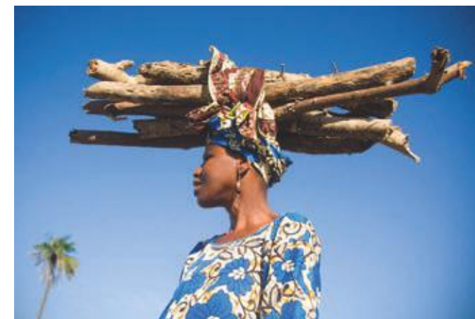
Новинки есть, но из столицы 25