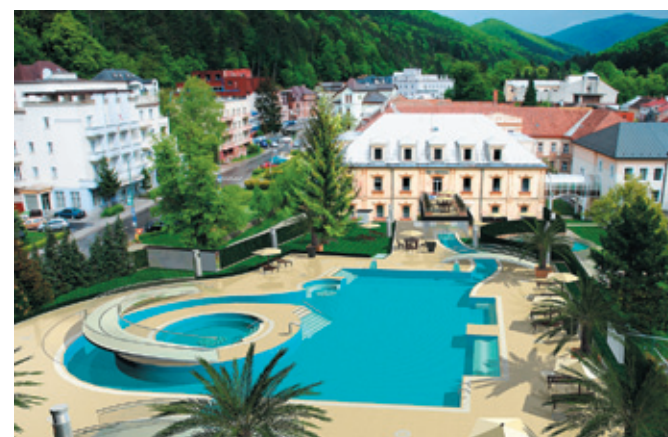
В Венгрию за гармонией тела и духа