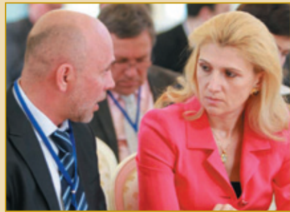
Андрей Тютюник, начальник Управления анализа и организации гостиничной и туристской деятельности Ростуризма

Туристско-информационные центры (ТИЦ) и пункты, объединенные в единую систему, вполне могут стать эффективным инструментом продвижения туристического потенциала России. Однако ее появления придется подождать: слишком разнятся по принципам организации и работы существующие структуры.