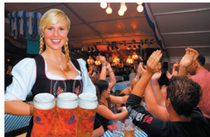
Событийный туризм: будет ли на нашей улице праздник?