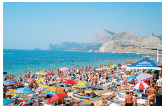
Россия – за граница: чья рубашка ближе к телу?